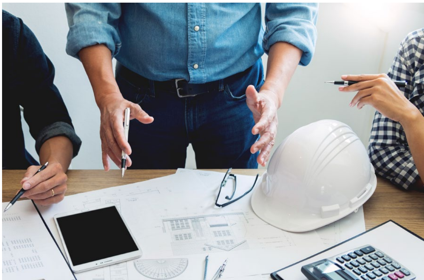
Momenti di confronto costruttivo e di interazioni sono fondamentali nell'operato quotidiano, così come durante il corso organizzato da CAT-OTIA e ATTEC.

stratori pubblici, segnatamente i Tecnici comunali e i Segretari comunali, l'onere organizzativo necessita un costante aggiornamento delle proprie conoscenze tecniche e legali.